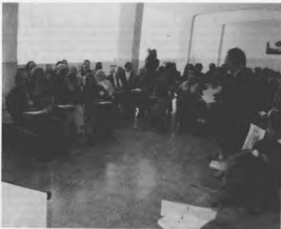
El Delegado de Cataluña, leyendo el mensaje final.