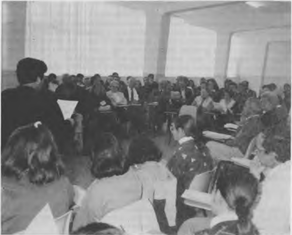
Vista parcial de la Asamblea.

De esta coincidencia de base y gracias a ella —a pesar de las discrepancias y aun de la sensación pesimista de los últimos momentos— pudo surgir el embrión de un movimiento universal.